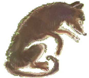
UN LOUP un loup