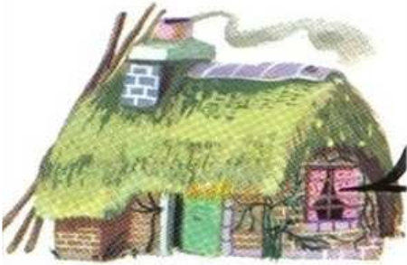
UNE MAISON une maison