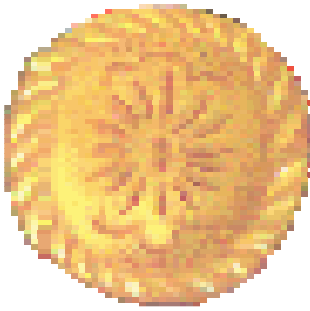
UNE GALETTE une galette