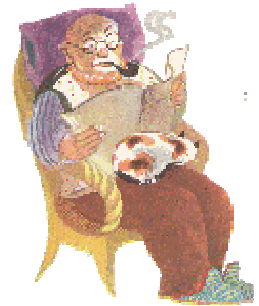
UN VIEUX un vieux