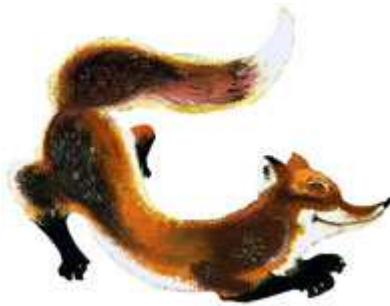
UN RENARD un renard