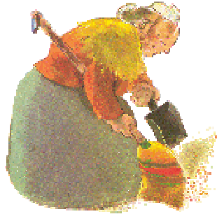
UNE VIEILLE une vieille