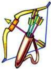
un arc et des flèches