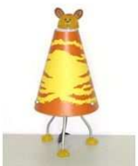
une lampe de chevet