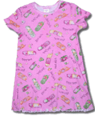
une chemise de nuit