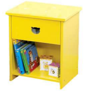
une table de nuit