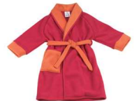
une robe de chambre